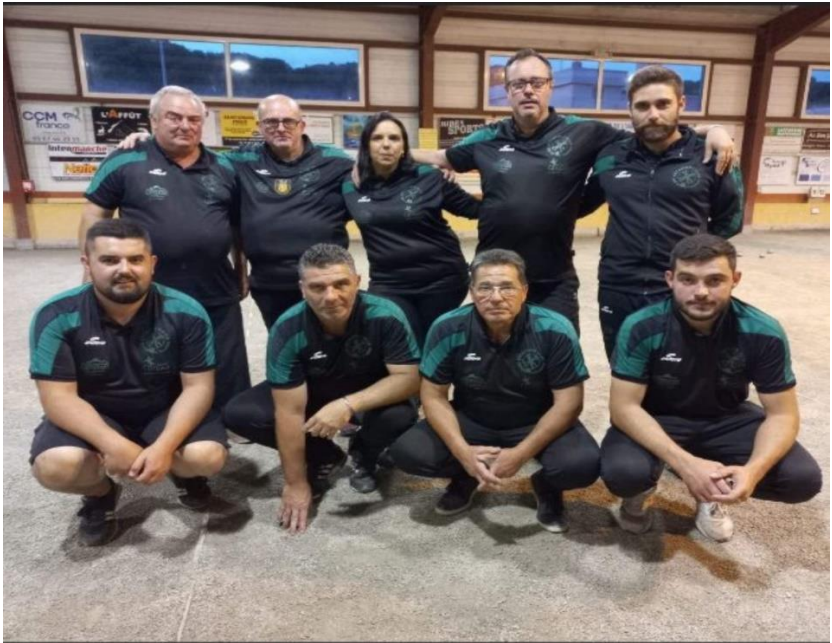
PETANQUE CLUB SAINT GIRONS COUSERANS QUALIFIE POUR LE 1 ER TOUR REGIONAL COUPE DE FRANCE DES CLUBS