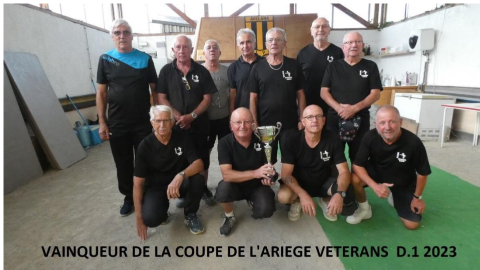
VAINQUEUR DE LA COUPE DE L'ARIEGE VETERANS D.1 2023