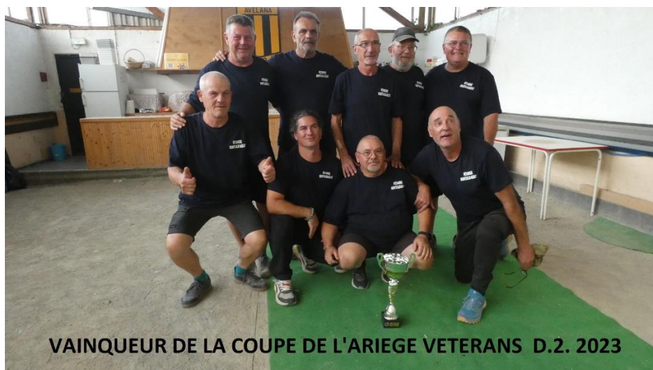
VAINQUEUR DE LA COUPE DE L'ARIEGE VETERANS D.2. 2023