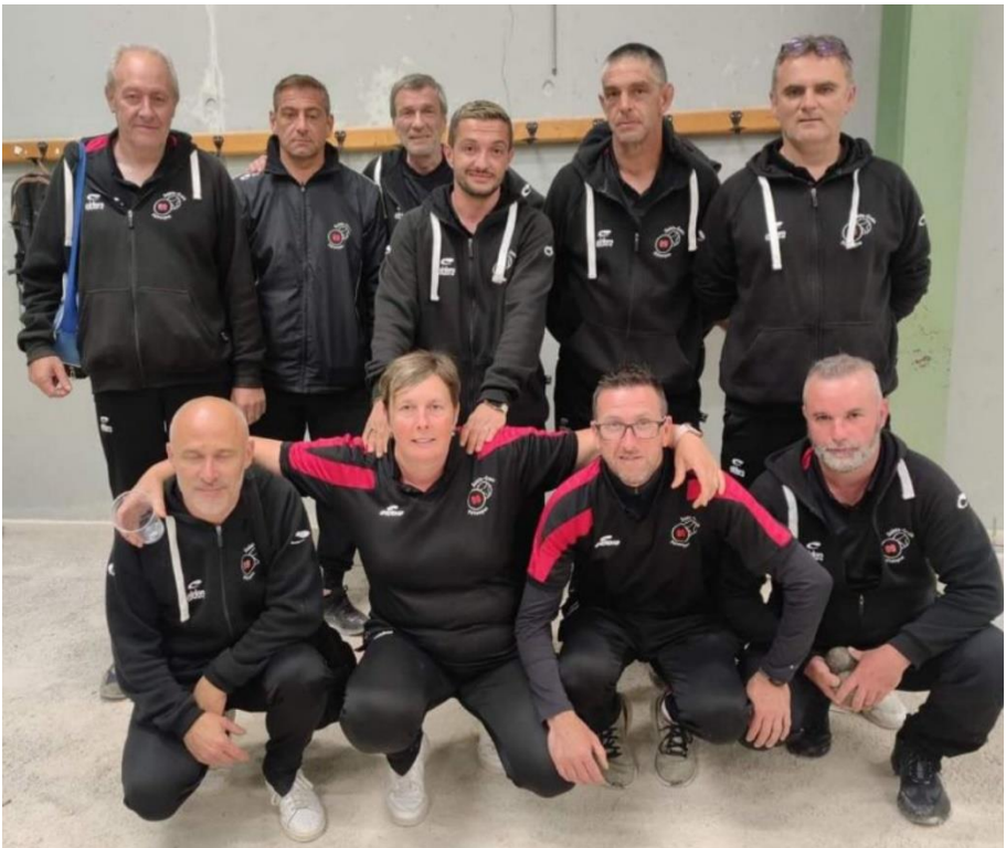
SAINTE CROIX PETANQUE QUALIFIEE POUR LE 1 ER TOUR REGIONAL COUPE DE FRANCE DES CLUBS