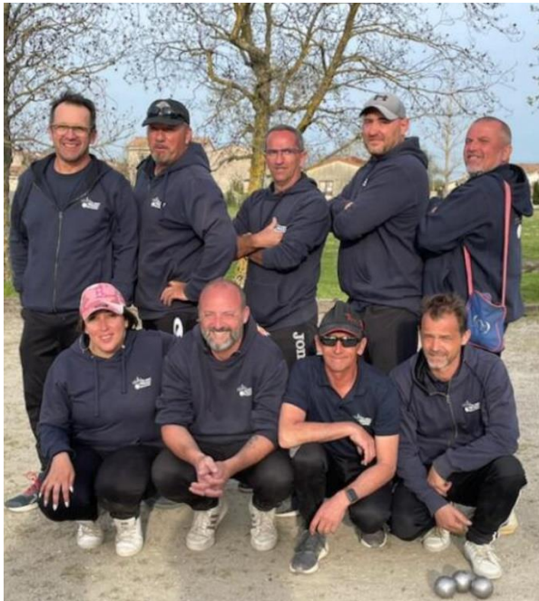
BOULE AMICALE VARILHOISE QUALIFIEE POUR 1 ER TOUR REGIONAL COUPE DE FRANCE DES CLUBS JEU PROVENCAL