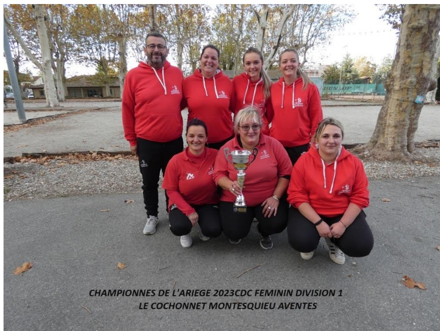
CHAMPIONNES DE L'ARIEGE 2023 CDC FEMININ DIVISION 1 LE COCHONNET MONTESQUIEU AVENTES