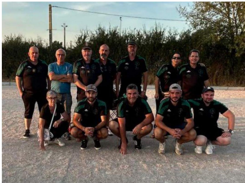
CHAMPIONS DE L'ARIEGE 2023 CDC JEU PROVENCAL PETANQUE CLUB SAINT GIRONS COUSERANS