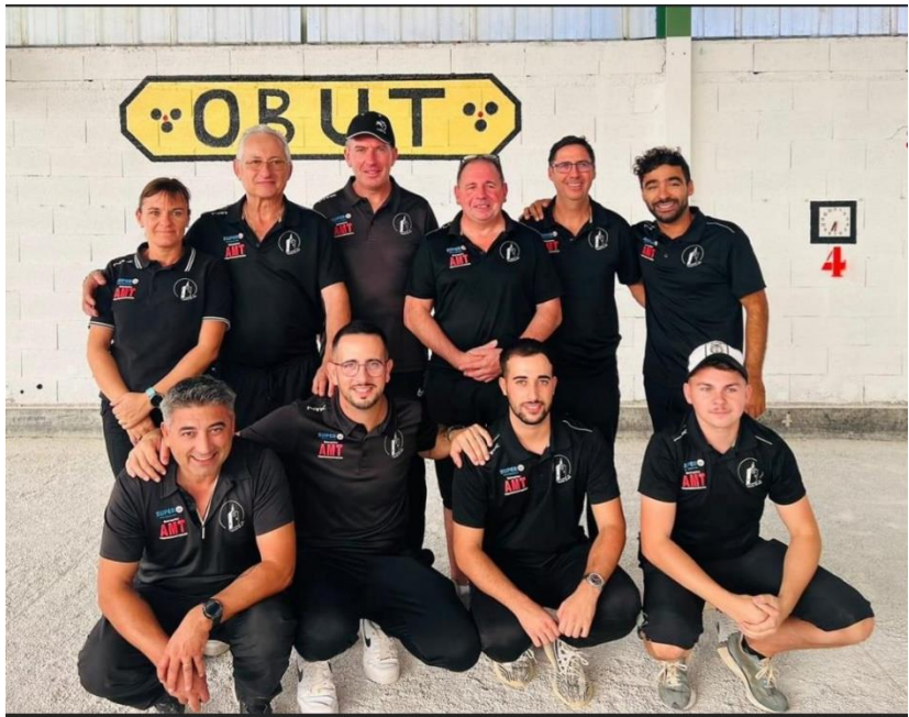
PETANQUE TARASCONNAISE QUALIFIEE 3 EME TOUR REGIONAL COUPE DE FRANCE DES CLUBS