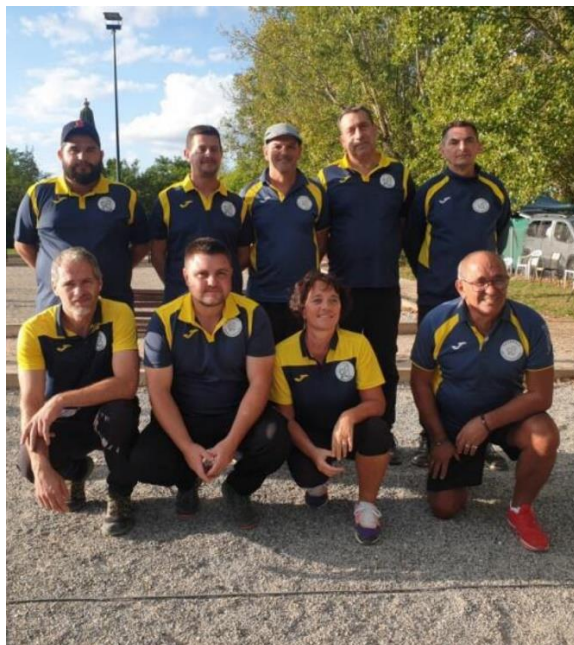
PETANQUE MERCUSIENNE QUALIFIEE 1 ER TOUR REGIONAL COUPE DE FRANCE DES CLUBS