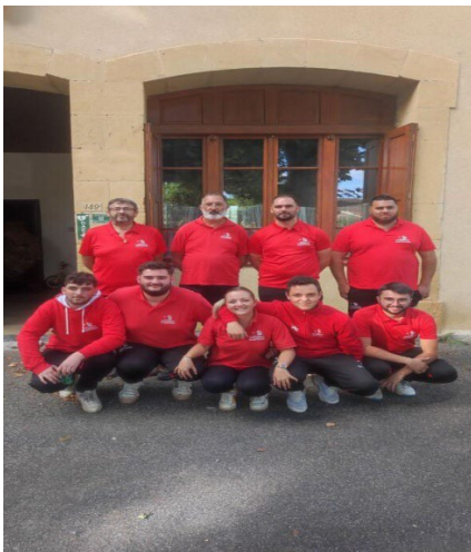
Cochonnet Aventésien 2eme tour régional Coupe de France des clubs