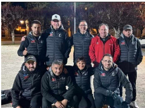
Pétanque Tarasconnaise 2ème tour régional Coupe de France des clubs