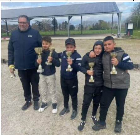
CDC Minimes champions de l'Ariège 2024 Boule Amicale Varilhoise