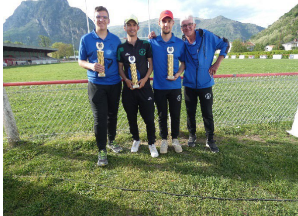
Champions de l'Ariège Triplètes Juniors 2024 Boule Lézatoise Pétanque Escosse Pétanque