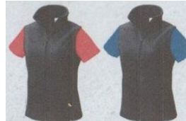
Manches decouleurs différentes