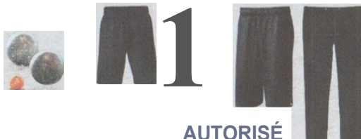
Modèle et couleur identiques