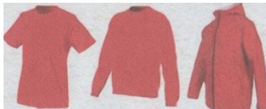
Hauts demême couleurs et demême conception