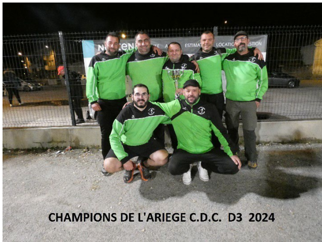
CHAMPIONS DE L'ARIEGE C.D.C. D3 2024