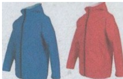
Haut de couleur différente