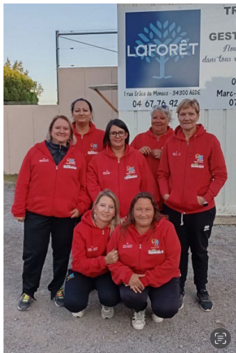
Pétanque Axéenne ¼ Finaliste CRC Féminin 2024