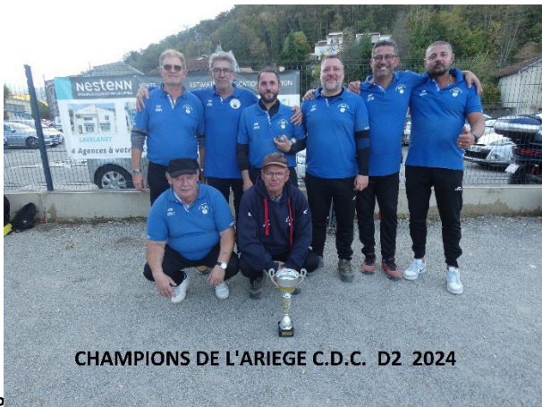
CHAMPIONS DE L'ARIEGE C.D.C. D2 2024