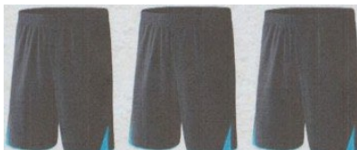
Modèle et couleur identiques