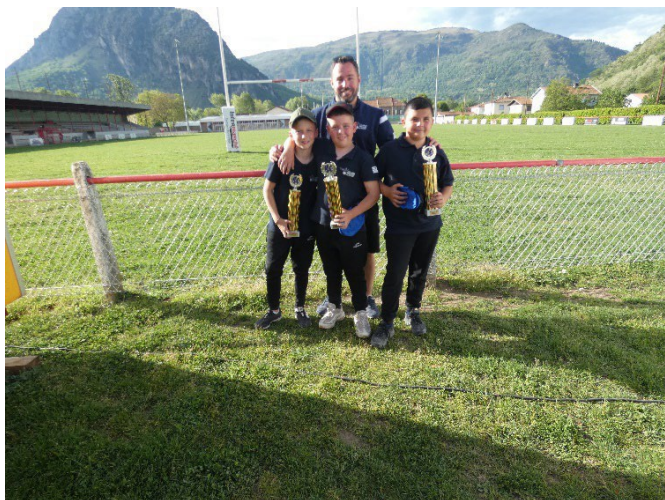
Champions de l'Ariège triplètes Minimes 2024 Boule Amicale Varilhoise