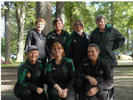
Pétanque Club Saint Girons Couserans ¼ Finaliste CRC Féminin 2024