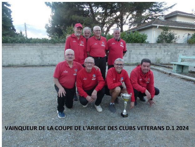
VAINQUEUR DE LA COUPE DE L'ARIEGE DES CLUBS VETERANS D.1 2024

Jeudi 9 Octobre 2025 Finale Coupe ariège D1 et D2